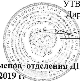
График проведения экзаменов отделения ДПО на июль 2019 г.